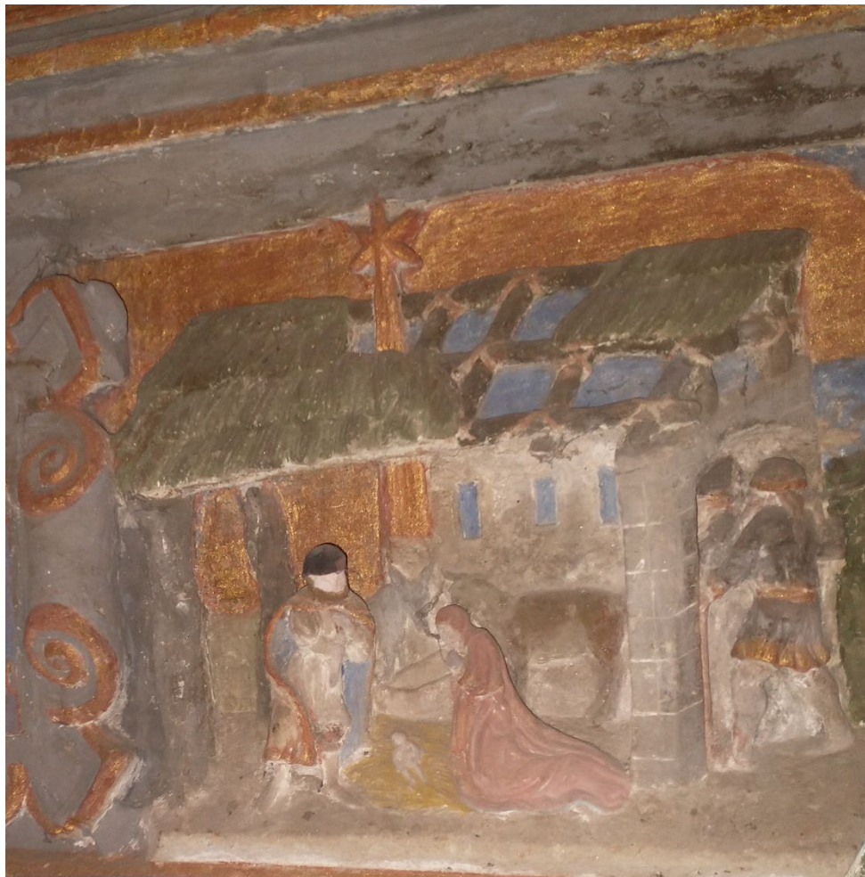
Ausschnitt aus dem Altar Kirche Pomßen

Evangelisch-Lutherische Landeskirche Sachsens